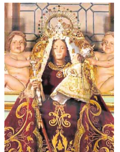
Nuestra Señora de Linarejos. E.

J. J. GARCÍA. Las tradicionales Fiestas del Voto en honor de Nuestra Señora de Linarejos Coronada, alcaldesa honoraria perpetua y patrona de la ciudad, dieron el pistoletazo de salida, ayer, con la apertura de la tómbola de las muñecas, las atracciones y las primeras actividades de la programación. Hoy tendrá lugar, a las 12:30 horas, la misa de renovación del voto por parte del alcalde.